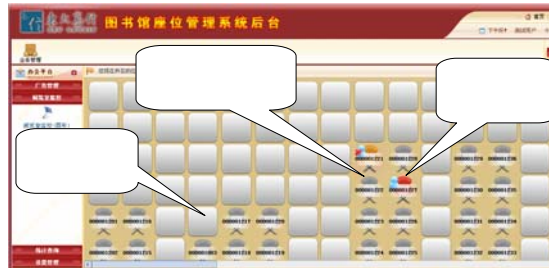
图4 座位后台实时监控图形化界面