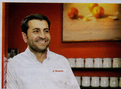
PETER SCHINZLER / DER SPIEGEL

Im Dezember 2018 machte der SPIEGEL die Fälschungen seines ehemaligen Redakteurs Claas Relotius öffentlich und leitete eine gründliche interne Untersuchung ein. Der Bericht über den Betrugsfall liegt jetzt vor. Seite 130