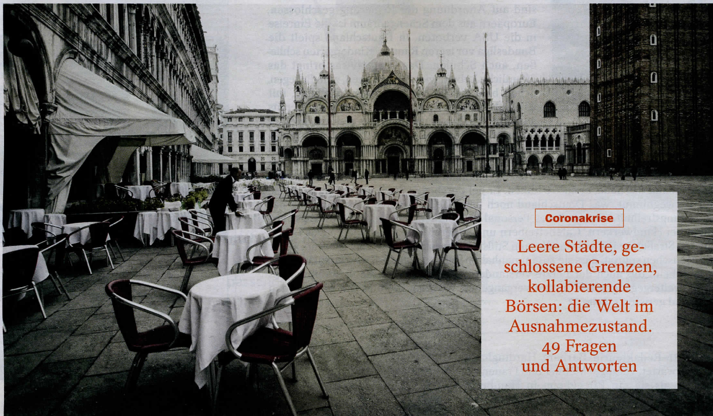
MIRCO TONIOLO / RÖPI