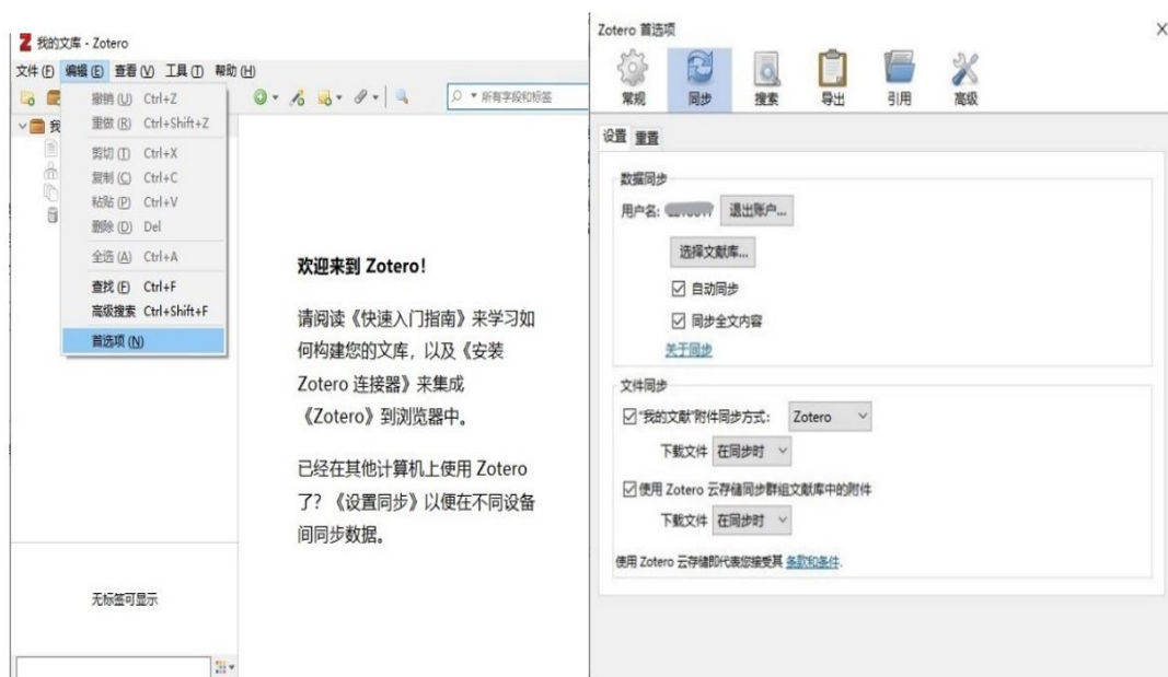
图 2 在线同步设置

要使用在线同步功能，需注册一个帐号。可直接在官网注册账号，或打开“编辑—首选项—同步”，点击“创建账户”，完成后输入帐号密码，启用同步功能，这样就能在电脑、iPad、手机等不同终端设备上使用同一文献库。