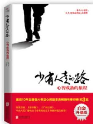
图 2 少有人走的路

在《纽约时报》畅销书榜单上，它停驻了近 20 年的时间。本书处处透露出沟通与理解的意味，它跨越时代限制，帮助我们探索爱的本质，引导我们过上崭新、宁静而丰富的生活；它帮助我们学习爱，也学习独立；它教诲我们成为更称职的、更有理解心的父母。归根到底，它告诉我们怎样找到真正的自我。正如本书开篇所言：人生苦难重重。M.斯科特·派克让我们更加清楚：人生是一场艰辛之旅，心智成熟的旅程相当漫长。但是，它没有让我们感到恐惧，相反，它带领我们去经历一系列艰难乃至痛苦的转变，最终达到自我认知的更高境界。