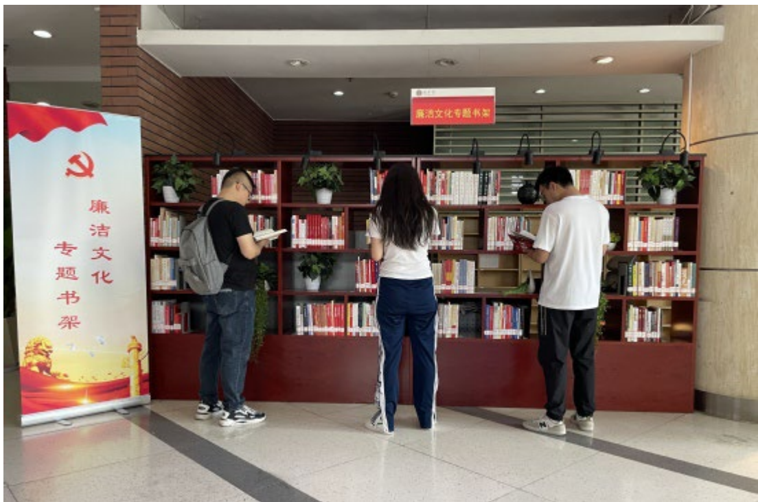
图1 “廉洁文化”专题书架

为深入贯彻落实党的二十大精神，推动全面从严治党向纵深发展，进一步加强学校党风廉政建设，弘扬“尚理”廉洁文化，根据中共中央《关于加强新时代廉洁文化建设的意见》，结合学校不敢腐、不能腐、不想腐一体推进工作实际，近日，我校湛恩纪念图书馆在一楼大厅设立“廉洁文化”专题书架，以书香启智润德。