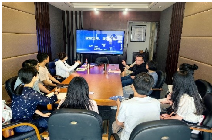
图2 青年馆员职业生涯培训分组培训（第3组）现场

新技术变革下的创新服务以及公平包容的阅读体验引导青年馆员思考自己的职业生涯规划。陈馆长指出：“不变的是对图书馆工作的热爱与热情，变的是馆员的思维方式与现实技术的运用，要