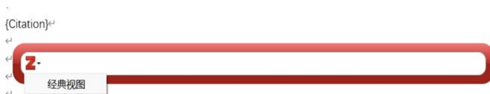
图 7 进行文献查找

确定引用样式后，出现红色引用栏，在此输入作者姓名或文章标题寻找引用文献，也可点击向下按钮，通过“经典视图”查找参考文献。