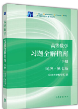
图8 高等数学习题全解指南:同济·第七版

是按《高等数学》(下册)的章节顺序编排，给出习题全解，部分题目在解答之后对该类题的解法作