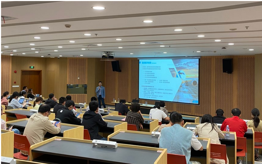
图 1 学术沙龙现场实况

活动伊始，来自 SAE International 的资深组稿编辑常志聘介绍了国际自动机工程师学会在全球范围内出版的各类专业学术期刊、国际学术会议论文、预印本平台等多样化的投稿路径。此外，在结合我校科研评价体系的基础上，详细介绍了 SAE 最新征稿发文信息、投稿渠道和流程、论文评审标准、论文收录情况等青年教师关注的热门问题。