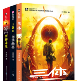
图 3 三体

内容简介：文化大革命如火如荼进行的同时，军方探寻外星文明的绝秘计划“红岸工程”取得了突破性进展。但在按下发射键的那一刻，历经劫难的叶文洁没有意识到，她彻底改变了人类的命运。地球文明向宇宙发出的啼鸣，以太阳为中心，以光速向宇宙深处飞驰。四光年外，“三体文明”正苦苦挣扎——三颗无规则运行的太阳主导下