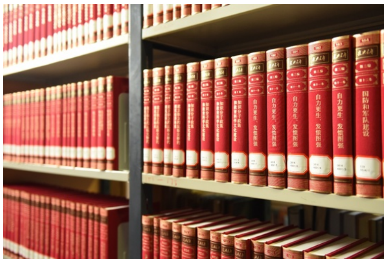
图1 图书馆上架《复兴文库》大型历史文献丛书

《复兴文库》的编纂发行，是党中央批准实施的重大文化工程。该丛书是由中国出版集团和中华书局承担编辑出版的大型历史文献丛书，全五编包含60多