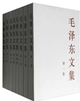
图 4 毛泽东文集

的百余次毁灭与重生逼迫他们逃离母星。而恰在此时，他们接收到了地球发来的信息。在运用超技术锁死地球人的基础科学之后，三体人庞大的宇宙舰队开始向地球进发。人类的末日悄然来临……刘慈欣，中国科普作家协会会员，山西省作家协会会员，中国科幻小说的主要代表作家，被誉为中国科幻的领军人物。自上世纪九十年代开始发表科幻作品，曾于 1999 年至 2006 年连续八年获得中国科幻银河奖，作品因宏伟大气、想象绚丽而获得广泛赞誉。他的科幻小说成功地将空灵和厚重的现实结合起来，同时注重表现科学的内涵和美感，兼具人文的思考与关怀，努力创造出一种具有中国特色的科幻文学样式。