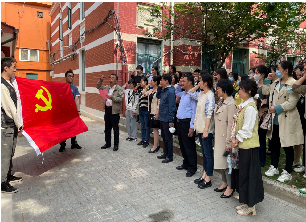
图1 “重温入党誓词”主题党日活动

参观结束后，大家纷纷表示，主题党日活动受益匪浅，今后将以更加昂扬的姿态、务实的作风，勇于担当、善于作为，推动学校党建工作提质增效，为学校建设高水平大学贡献智慧与力量。