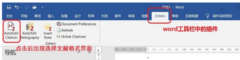
图 6 文献引用界面

安装 Zotero 后，Word 工具栏上会自动出现插件。打开 Word 文档，把光标移到需要添加参考文献的地方，点击“Add/Edit Citation”，出现选择文献格式的界面。