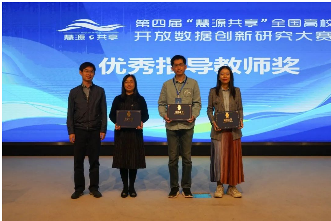
图 1 获奖照片

请 17 位业界专家进行独立评审，并采取同校专家与同校团队作品回避原则，最终产生 15 支队伍进入答辩环节。经过形式审查、专家复审和决赛答辩，最终评选出特等奖 1 组、一等奖 2 组、二等奖 4 组、三等奖 8 组、优秀奖 17 组，另有 16 位指导教师获得“优秀指导教师奖”。