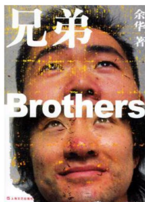
图 5 兄弟

内容简介：毛泽东是伟大的马克思主义者，无产阶级革命家、战略家和理论家。他一生中写下大量文稿，作过许多演讲和谈话，这是一笔极为珍贵的精神财富。本书是毛泽东在新中国建立前后的主要著作。此外，他还有大量的文稿和讲话谈话记录稿，其中有相当部分内容对于我国建国和发展十分重要，对于深入地学习和研究毛泽东思想极具价值。经中共中央批准，将上述内容比较系统地选编成本书集结出版。