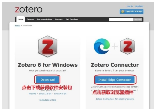
图 1 Zotero 下载界面

除应用程序外，使用 Zotero 时还需安装适用于浏览器（Edge、Chrome、Firefox、Safari）的 Zotero Connector（连接器）插件，插件可实现在浏览器上快速添加文献到 Zotero，保存源文件或网页中文献的相关信息，点击网页右边按钮即可获取浏览器插件。