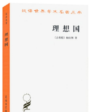
图 1 理想国