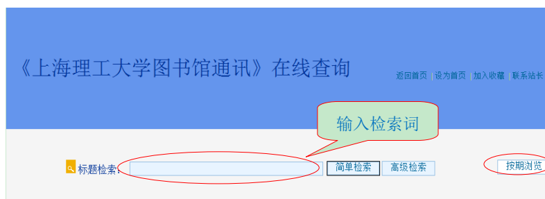
图 1 简单检索界面

《上海理工大学图书馆通讯》为季刊，主要设置特稿、图书馆工作、文献利用、馆员心声、读者沙龙、简讯等栏目，全方位报道图书馆的发展动态，详细介绍图书馆的各种资