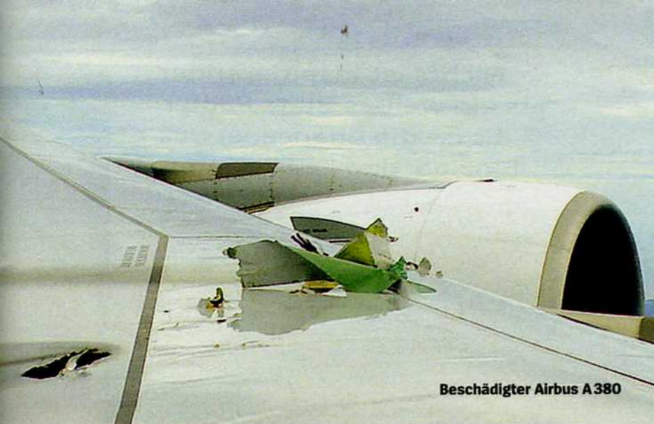
Beschädigter Airbus A380