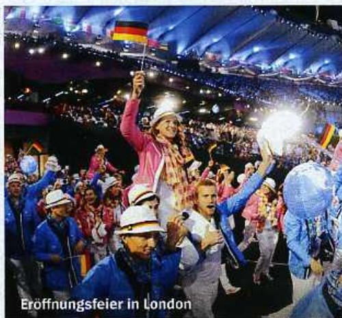
Eröffnungsfeier in London

Die Sommerspiele in London haben begonnen, selbst die besten Athleten spüren den Erwartungsdruck. Robert Harting ist der Favorit im Diskuswerfen. Jahrelang hat er auf ein Privatleben und berufliche Perspektiven verzichtet, nun brauche er den Olympiasieg unbedingt, sagt Harting: „Um nicht zu zerbrechen.“