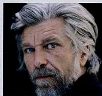
Karl Ove Knausgård

Wegweiser für Informanten: www.spiegel.de/investigativ