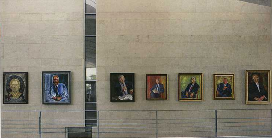
Galerie im Bundeskanzleramt

Trends: Britischer Geheimdienst attackiert Belgacom / Schikanen gegen Aldi-Mitarbeiter / Bundesagentur für Arbeit verschiebt Stellenabbau ..... 72 Handel: Nicolas Berggruens Karstadt-Strategie ist gescheitert ..... 74 Lufthansa: Der scheidende Konzernchef hinterlässt viele unerledigte Aufgaben ..... 76 Korruption: Die fragwürdigen Indien-Geschäfte des Rüstungskonzerns Rheinmetall ..... 78 Mittelstand: Familienunternehmen werden vom Staat mit Steuerprivilegien verwöhnt – zu Recht? ..... 82