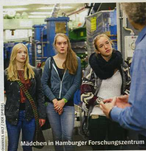
Mädchen in Hamburger Forschungszentrum

Karstadt-Eigner Nicolas Berggruen verkauft zwar die Premium- und Sporthäuser, glaubt aber angeblich noch an die Zukunft des Kaufhauskonzerns. Bei den Mitarbeitern lösen seine Pläne eher Existenzängste aus.