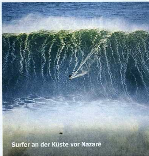
Surfer an der Küste vor Nazaré

In einem Tiefseegraben vor Nazaré in Portugal entstehen nach schweren Stürmen Wellen im Hochhausformat. Profisurfer aus aller Welt belagern den Fischerort, um den Rekordbrecher zu erwischen, darunter auch der deutsche Extremsportler Sebastian Steudtner. Der Bürgermeister von Nazaré vermarktet das riskante Spiel mit den Naturgewalten inzwischen erfolgreich als Touristenattraktion.