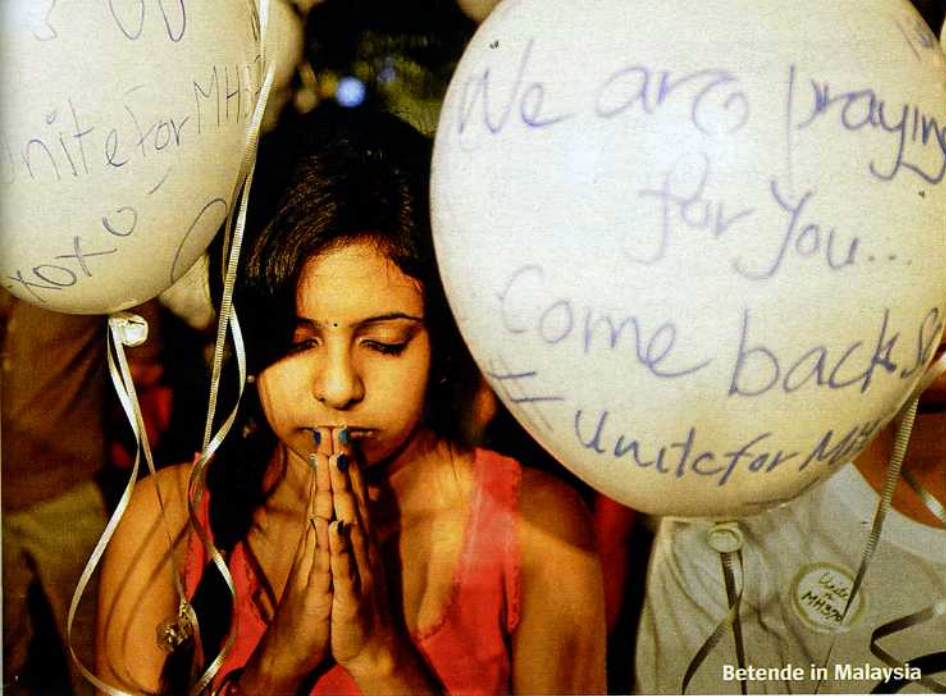
Betende in Malaysia