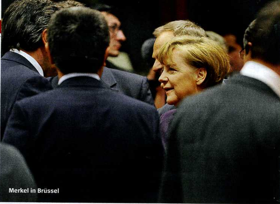
Merkel in Brüssel

Trends: VW ändert Modellstrategie / Deutsche-Bank-Chef Jürgen Fitschen riskiert den Prozess / Mehr Geld für Quandt & Co. ... 59 Energie: Wirtschaftsminister Sigmar Gabriel will die Industrie vor steigenden Strompreisen bewahren ..... 60 Verkehr: Die Bilanz des Bahn-Chefs Rüdiger Grube fällt bescheiden aus ..... 63 Währungen: Frankfurt soll wichtigster europäischer Handelsplatz für Chinas Währung Yuan werden ..... 64 Landwirtschaft: Lasche Kontrollen erleichtern den Betrug mit angeblichen Bio-Eiern ..... 66 Geldanlage: Betreiber von Schiffsfonds fordern Ausschüttungen zurück ..... 68 Gesundheit: Reform der gesetzlichen Krankenkassen nützt privaten Anbietern ..... 70