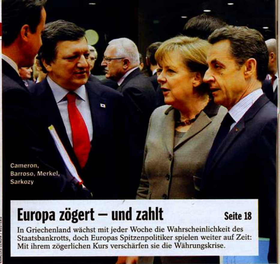
Cameron, Barroso, Merkel, Sarkozy

Panorama: Kampf um die Nachfolge von Ahmadinedschad / Die Wahl eines deutschen Papstes verunsicherte die USA / Hungersnot in Nordkorea ..... 85