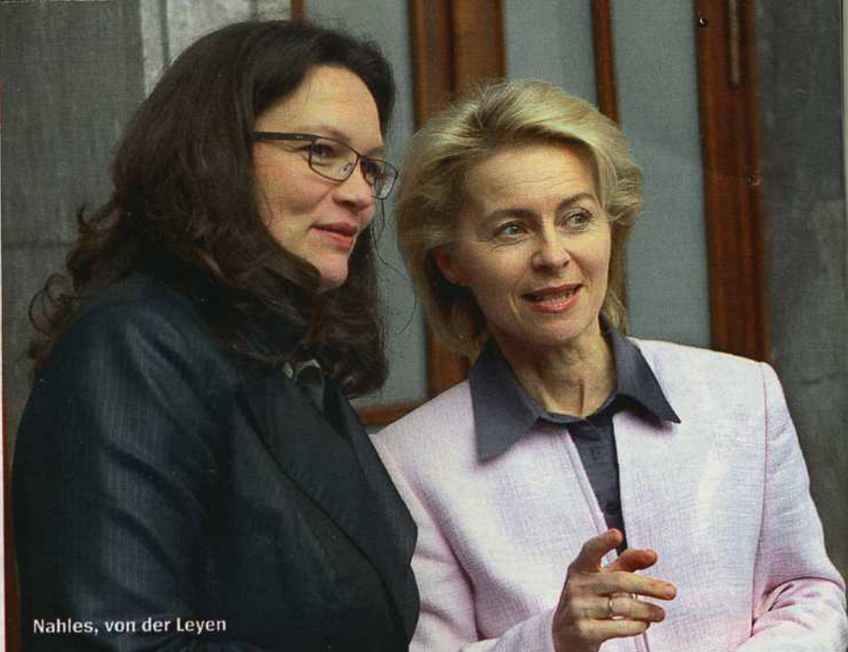
Nahles, von der Leyen

Trends: CDU und SPD wollen Steuerflucht erschweren / China boykottiert deutsches Fleisch / Der neue Reichtum der Twitter-Gründer ..... 86 Geldpolitik: Die EZB kämpft gegen die Deflation, doch die Inflationsgefahr ist keineswegs gebannt ..... 88 Deutsche Bank: Ausgerechnet Co-Chef Jürgen Fitschen steht im Visier der Staatsanwälte ..... 90 Energie: Im SPIEGEL-Gespräch äußert sich BASF-Chef Kurt Bock über seine Befürchtungen zur Zukunft des Industriestandorts Deutschland ..... 92 Konzerne: Warum Daimler bei Christie's ein Werk von Warhol versteigern lässt ..... 95 Geheimdienste: Der britische GCHQ spähte Mitarbeiter von Mobilfunkfirmen aus ..... 96 Erkenntnisse aus dem Innersten der Opec ..... 98