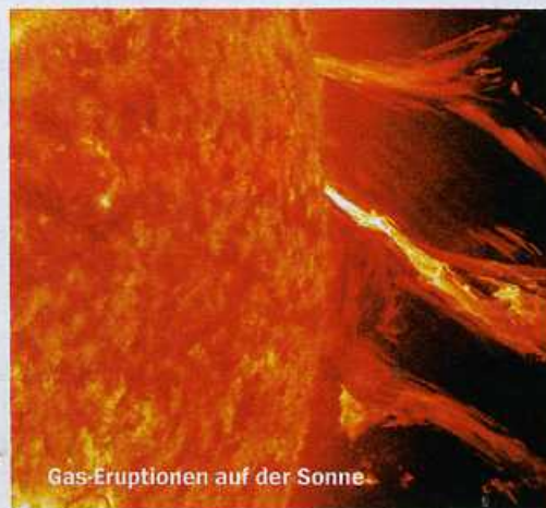
Gas-Eruptionen auf der Sonne

IBM plant einen radikalen Umbau des Unternehmens. Künftig soll eine Kernbelegschaft den Konzern steuern, ein Heer freier Mitarbeiter wird in virtuellen Netzwerken kontrolliert und kämpft um befristete Jobs.