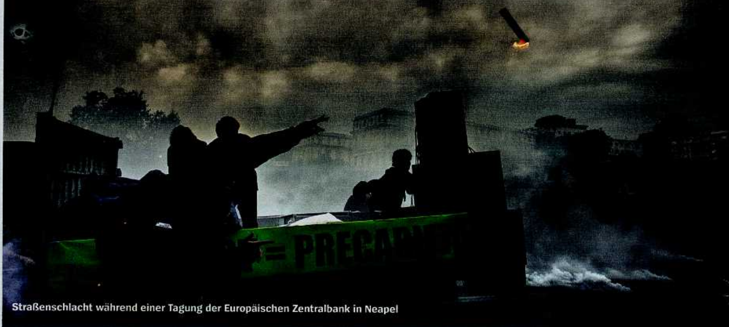
Sträßenschlacht während einer Tagung der Europäischen Zentralbank in Neapel

Finanzmärkte Der langfristige Trend der Wirtschaft gehe nach unten, sagt der Investmentexperte Mohamed El-Erian. Einige Politiker hätten den Ernst der Lage nicht begriffen. Seite 72