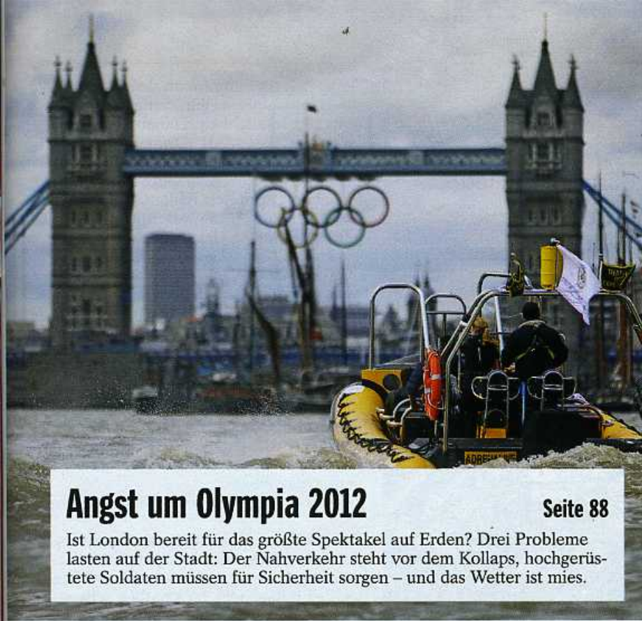
LEIFERIS PITAKAKIS / AP