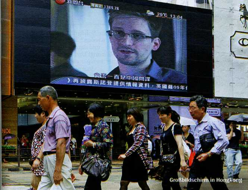
Großbildschirm in Hongkong