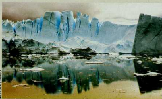
Eisberg in Grönland

Der Klimawandel lässt die Ozeane anschwellen – aber nicht überall. Denn das Schmelzwasser verteilt sich ungleich über die Weltmeere: Taut das Grönland-Eis, steigen die Pegel am stärksten auf der Südhalbkugel. An der deutschen Küste dagegen ändert sich kaum etwas. In Norwegen und in Grönland sinkt der Meeresspiegel sogar.