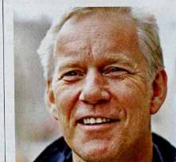
Johannes B. Kerner

Sie ist Informatikerin, stammt aus Ägypten und will eine neue Ära des „emotionalen Rechnens“ eröffnen. Ihre Firma bringt Computern bei, aus der Mimik eines Menschen dessen Gefühle abzulesen. Seite 116