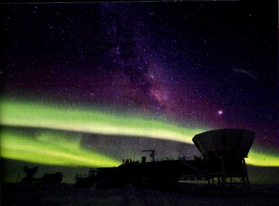
Amundsen-Scott-Station am Südpol