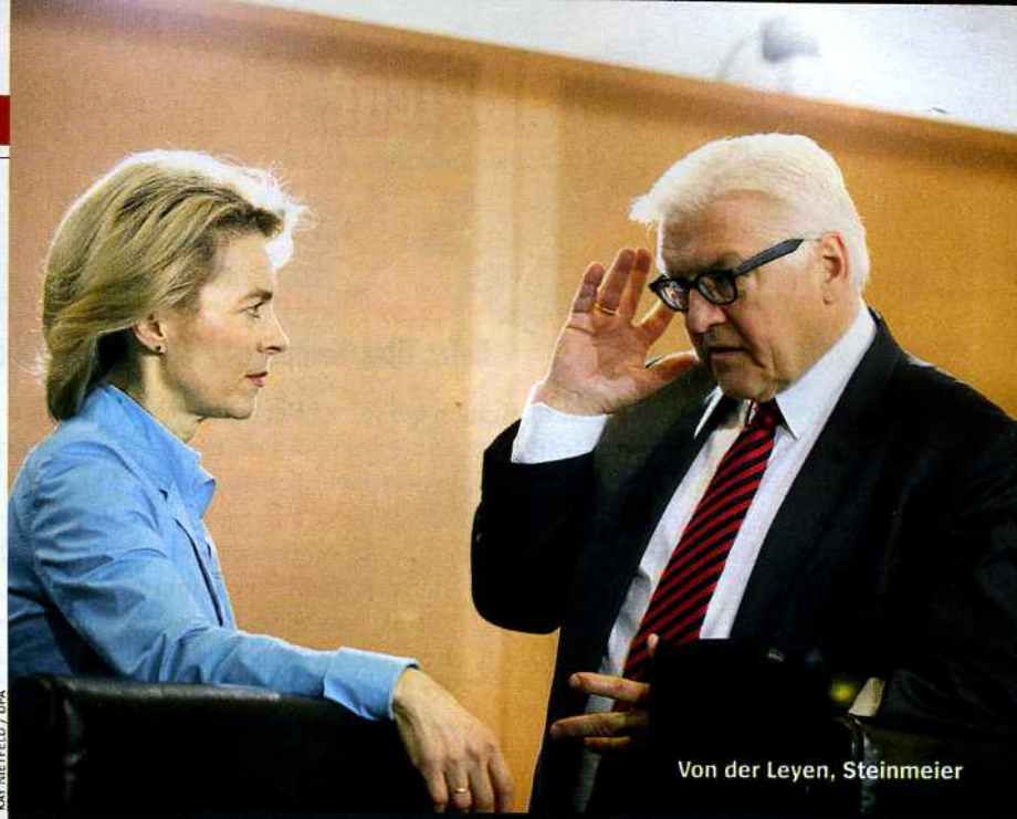
Von der Leyen, Steinmeier

Essay: Die machtlosen Supermächte ..... 81