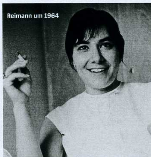
Reimann um 1964