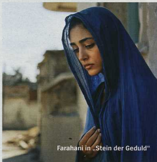
Farahani in „Stein der Geduld“

Weil die iranische Schauspielerinnen Golshifteh Farahani einen Film mit Leonardo DiCaprio drehte, fiel sie in ihrer Heimat in Ungnade. Mittlerweile ist die schöne Perserin auf dem Weg zum Weltstar. In der Romanverfilmung „Stein der Geduld“ spielt sie jetzt eine Afghanin, die eine unglückliche Ehe führt und gegen die Traditionen aufbegehrt.