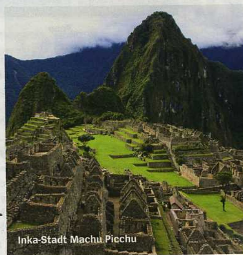
Inka-Stadt Machu Picchu

Nach der Katastrophe von Lampedusa fordern Experten eine Reform der europäischen Flüchtlingspolitik. Die Bundesregierung aber klammert sich an das alte System, aus Angst vor noch mehr Asylbewerbern.