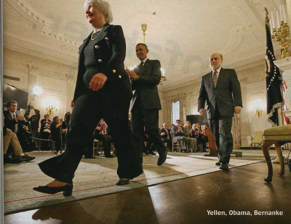
Yellen, Obama, Bernanke