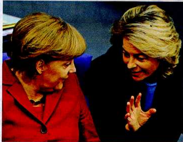
Merkel, von der Leyen

Die Kanzlerin will ihren Führungsstil aufpolieren. Im Urlaub hat sie sich überlegt, dass das schlechte Bild von der Bundesregierung auch mit ihr zu tun hat. Künftig will sie öfter ein Machtwort sprechen, zumal sie im Herbst über mehrere umstrittene Reformprojekte entscheiden muss. Vor allem Sozialministerin Ursula von der Leyen hofft auf die Hilfe der Kanzlerin. Sie will Bildungsguthaben für Kinder aus sozial schwachen Familien einführen.