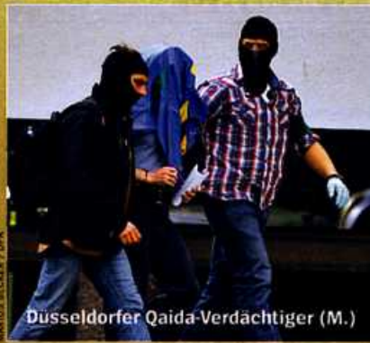
Düsseldorfer Qaida-Verdächtiger (M.)