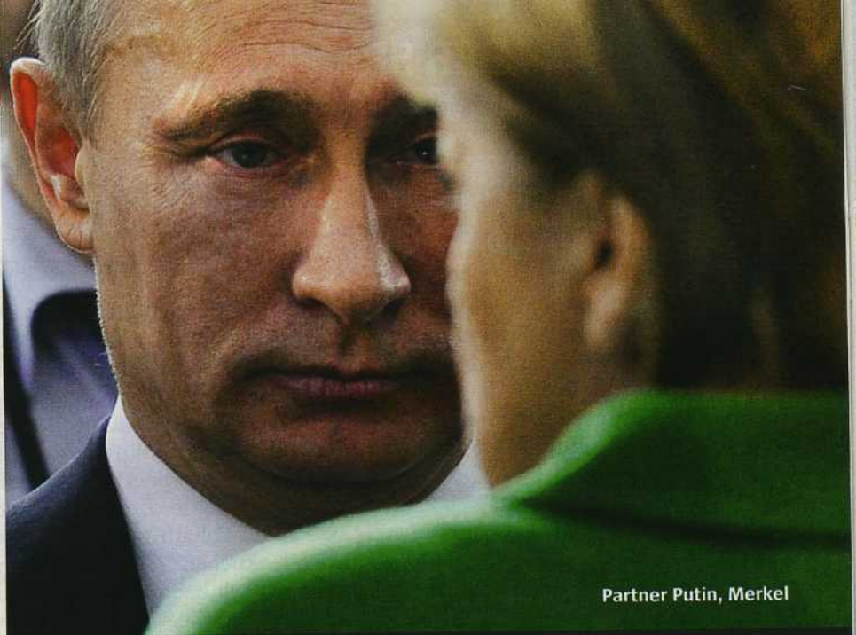
Partner Putin, Merkel